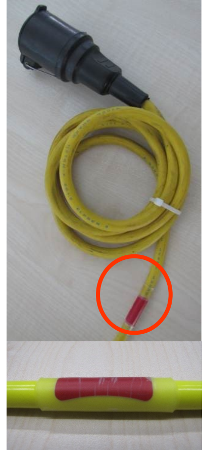
Kabel-/Schlauchtransponder mit Schrumpfschlauch robust angebracht